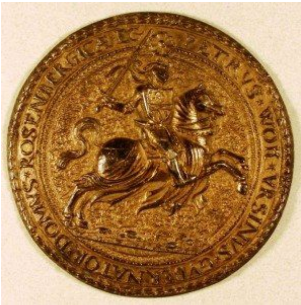
Pečetidlo pana Voka

Dnes k Vám promluví poslední vladař rožmberského dominia pan Petr Vok. Takže to nebudu protahovat a dávám mu slovo.