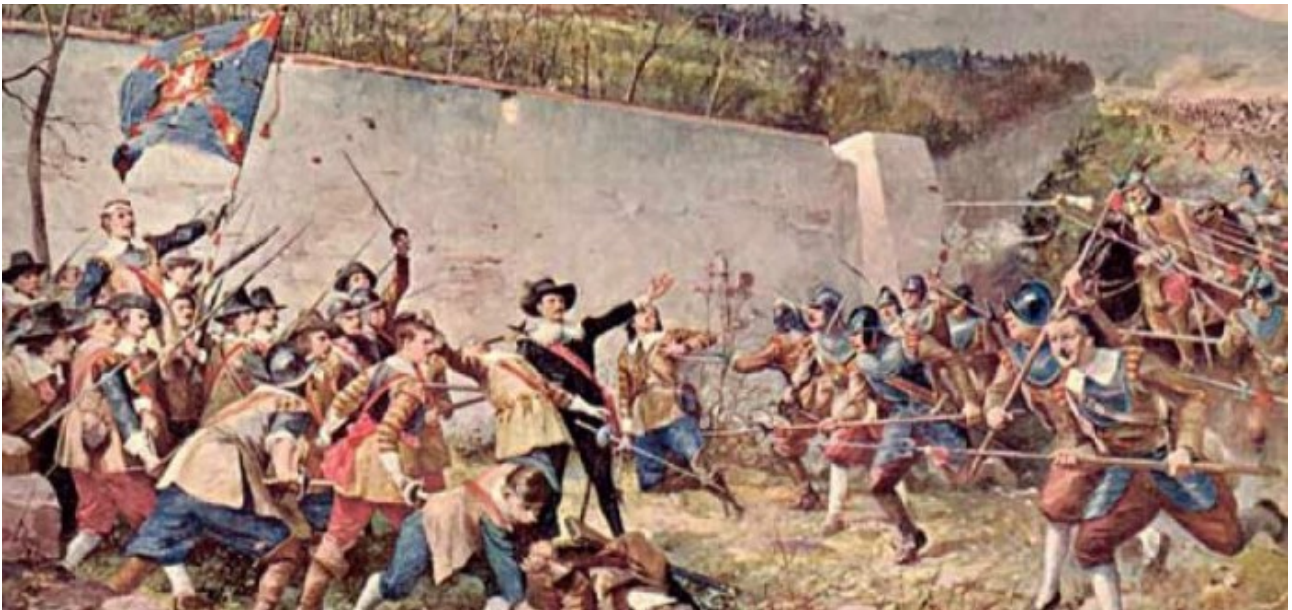
Porážka na Bílé Hoře nebyla nevyhnutelnou, ale za daných okolností se dala očekávat

Při práci na Komenského výstavě i na dalších projektech, týkajících se duchovních a sociálních dějin jsem došel k zajímavým analogiím s dneškem. Stále se vrací vzoreček, který po generace, staletí vtlučený do hlavy nabyt hrůzných rozměrů samozřejmosti. Chceme být poddruhy a lokaji, děvečkami a sloužícími, nebo se vydáme směrem ke svobodě, odpovědnosti a ano, do rizik? Lokajské sobectví je do národního genomu vtěsnaný prvek, bez jeho odstranění budeme mít stále shrbená záda. Tentokrát vlastní vinou jako před čtyřmi sty lety. V roce 1620, přesněji 8. listopadu se na vrchu nad Břevnovem odehrála bitva, vlastně šarvátka – vešla do dějin a mýtů jako bitva na Bílé hoře. Porážka stavovských vojsk sice nebyla nevyhnutelná, ale dala se předpokládat. Zarážející je jiný moment příběhu, po skončení bitvy se Praha neopevnila a habsburští oblehatelé měli snadnou práci. Je za neochotou Pražanů bránit náboženské a politické svobody jejich nevěrnost ideálům, nebo spíš vyčerpání města a země sužovaných soldateskami, jedno z jaké strany? Jaký program jim přinášelo povstání?,,,,,