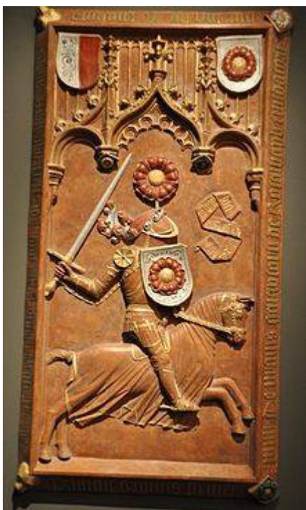
Náhrobní deska rožmberské hrobky ve Vyšším Brodě

Jenže co s ustupujícím a plenícím vojskem v zemi? Musel jsem se mu znovu postavit. Najal jsem další žoldáky ze svého i půjček. Dokonce jsem některé Pasovské přetáhl na svou stranu. U Třeboně jsem je nechal dojít až k obrannému valu a skoro je tu rozstřílel. Na 1400 jich prý zůstalo ležet pod hradbami. Jenže pomoc od pánů ani nového krále nikde. Ano, poslali několik oddílů, které zabránily tomu, aby mi prokopali hráze rybníků a zaplavili Třeboň, ale to bylo všechno. Žádná větší akce. Tak jsem začal vyjednávat. Pasovští souhlasili, že odejdou za 173 000 zlatých. 100 000 jsem ale musel zaplatit já. I přes zásluhy jsem to byl zase já, kdo šel s kůží na trh. Obětoval jsem „Rožmberský poklad“ a znovu si půjčil. Oficiálně to byla půjčka, ale bylo mi jasné, že ty peníze neuvidím nikdy zpátky. To je tak, když půjčujete panovnickému domu. Alespoň jsem zachránil své poddané od dalšího plenění. To ale byla má poslední radost. Dluhů jsem se už nezbavil a neměl jsem na to věru ani čas. 6. listopadu 1611 jsem vydechl naposledy.