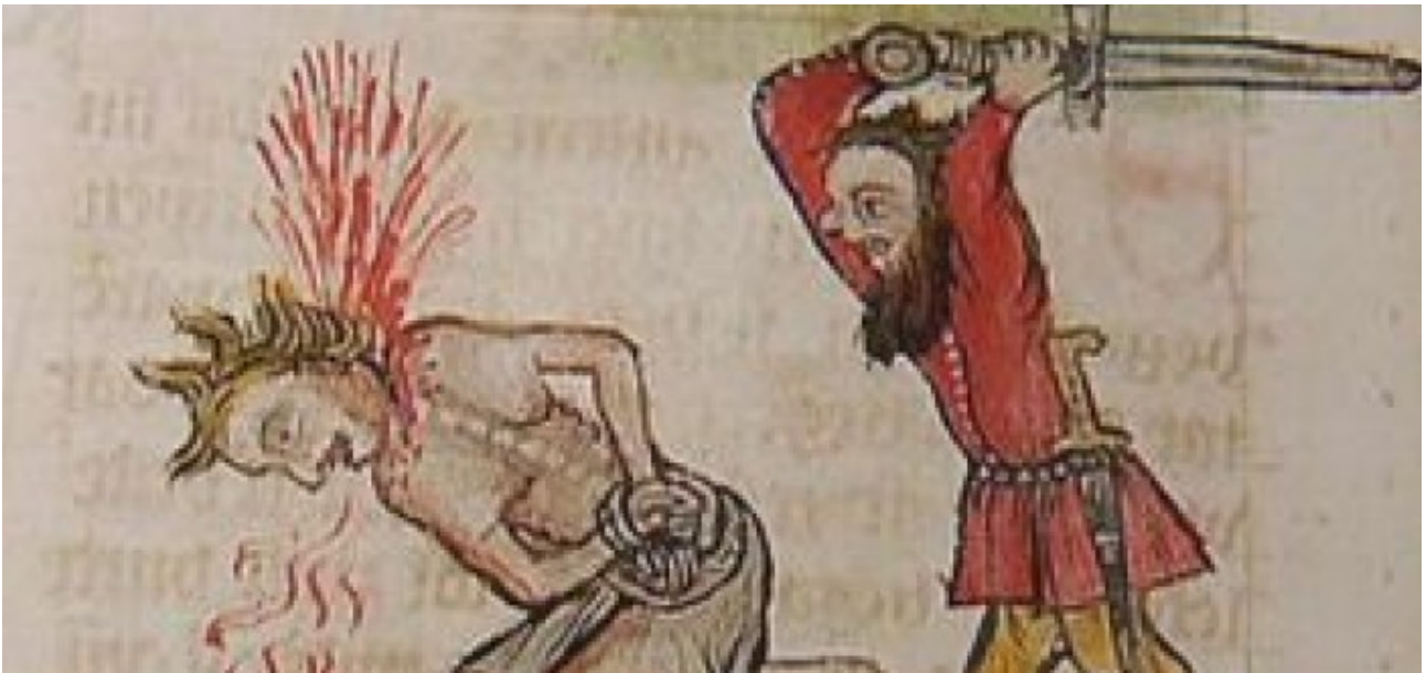
Stínání patřilo k dennímu chlebu mistra popravčího