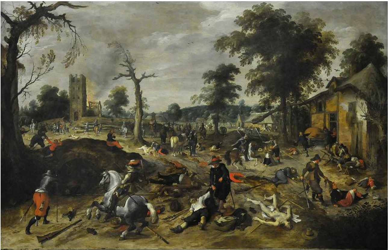
Rekatolizace po Třicetileté válce s sebou přinesla utužení roboty a nevolnictví

Kníže měl od lidu dále a předepsané chování mělo na tento rozdíl upozornit. Negativní tendence z předbělohorské doby dostaly zelenou a byly provázeny rozmachem poddanství: z poddaného, který měl postavení zaměstnance najímaného na práci, byl najednou div ne otrok. Četné poddanské vzpoury svědčí o neutěšeném stavu, chudobě i pomalém vzestupu selského stavu až v 18. století, před tím nebylo na rebelie ani pomyšlení (pokud nemluvíme o vzpouře Chodů).