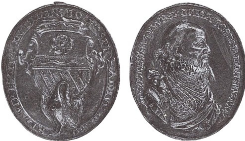
Vokova pohřební medaile

Růže tato vykořeněná: Ale jest do lepší zahrady přesazená. Není rod slavný pánův z Rožmberka rezptýlen, ale jest do své vlasti (věříme nebeské) všecken spolu shrnut a shromážděn. Zde na světě jedni podruhých succesive živi byli, nyní se všickni v onom životě shledali: Zde se neviděvše předkův a potomkův svých neznali, v věčném životě se shledali, uhledali a radostně poznali. “ — Matěj Cyrus