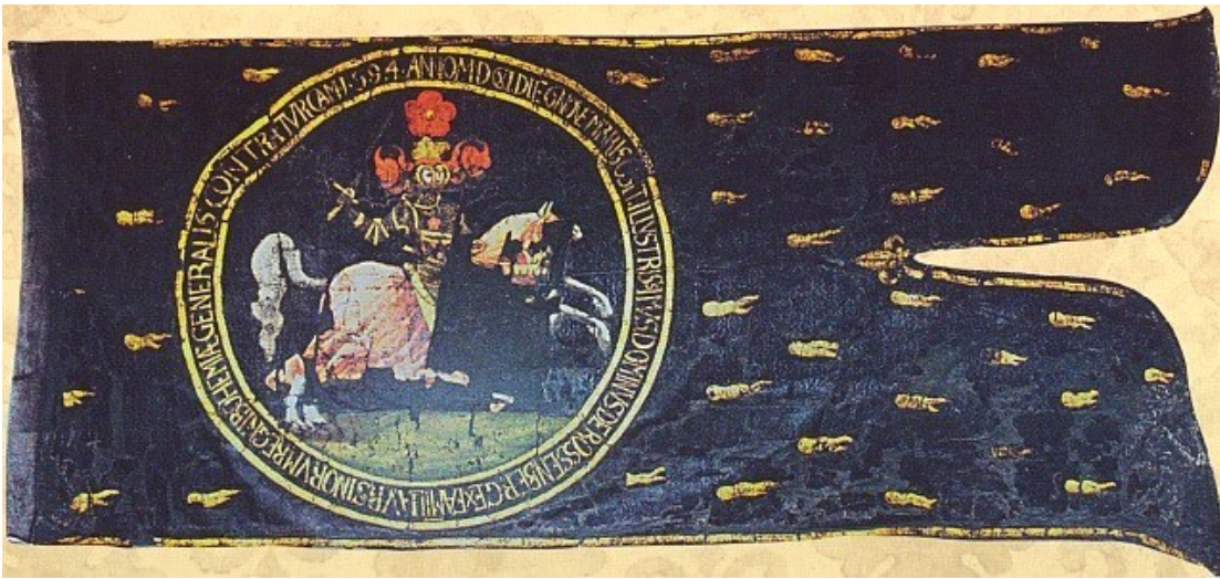
Smuteční prapor pana Voka