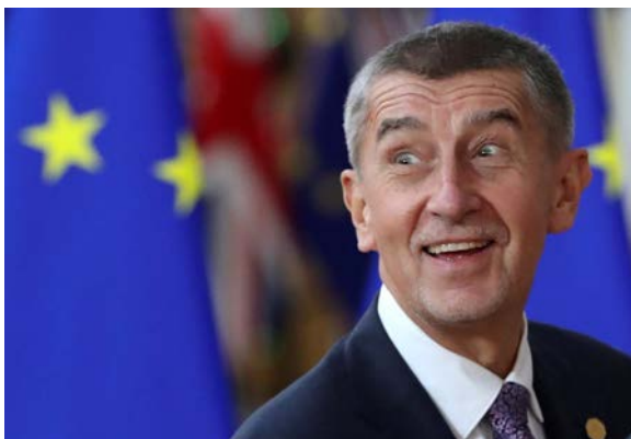
ANO, politické hnutí současného premiéra je populistickou oligarchií

Proč oslovuje ANO stále přes třicet procent obyvatel? Nevidí snad lidé chyby Andreje Babiše v průběhu krize? Nechyběly lidem roušky a neumírali zbytečně důchodci v sociálních zařízeních? Dochází ke zničení českého podnikání a oligarchové se opět budou mnout ruce a lidu to nevadí. Proč? Za odpovědí musíme jít do historie i do vyprávění o ní za posledních 30 let.