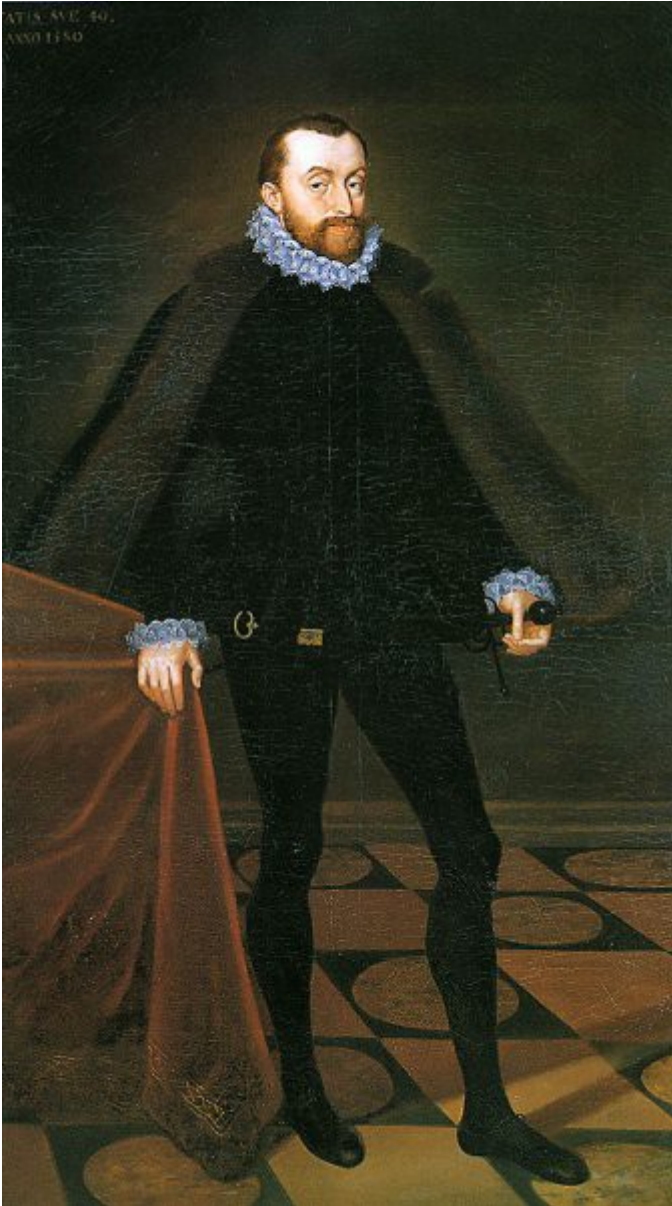
Pan Vok jako zralý muž

S pověstí prostopášníka: Situace se změnila po nástupu nového císaře Maxmiliána II. Během korunovační cesty jsem se seznámil s budoucím nizozemským místodržícím Vilémem Oranžským. Přijal jsem pozvání podívat se do Nizozemska a celou cestu jsem bedlivě studoval vše zajímavé. Viděl jsem hospodářské i technické vymoženosti na vrcholu naší doby. Porozuměl konečně náboženským i národnostním rozporům. Tak jsem projel protestantské země Německé a dojel ke dvoru pana Viléma. Všude jsem reprezentoval se svými přáteli dobré české jméno. Pořádali jsme zápasy a turnaje, kde jsme byli mezi favority a účastnili se nejednoho politického jednání. Já jsem i nedal jinak, než že jsem utrácel hotové jmění na kuriozity a umělecká díla, jež se mi líbila. Díky doporučení pana Viléma jsem se mohl setkat i s královnou Alžbetou Tudorovnou a mohl si přivést z Anglie smečku chrtů z toho nejlepšího chovu.