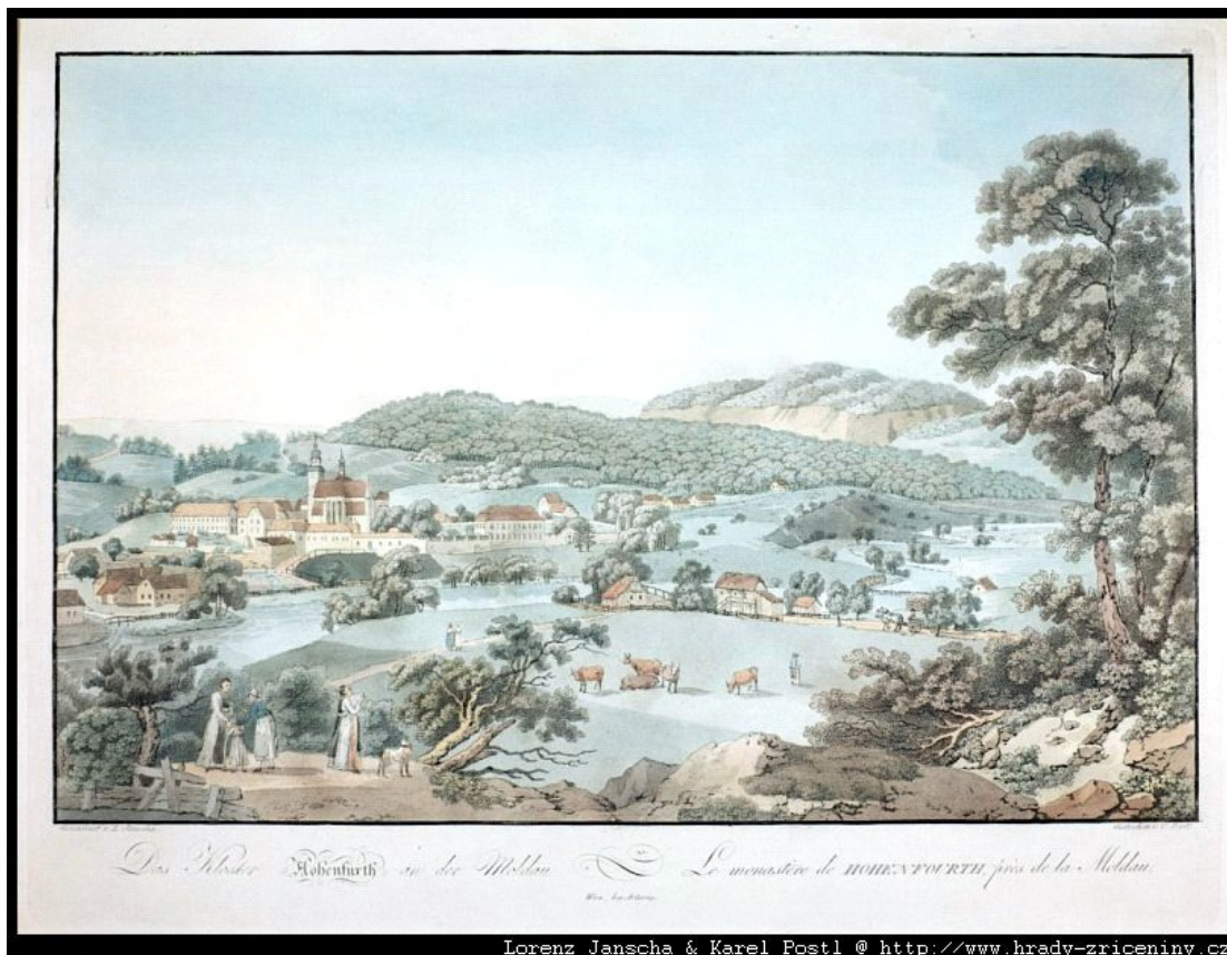
Vyšší Brod od Karla Postla a podle L. Janschy (kolorovaný lept, cca. 1800)

rožmberského fraucimoru. Jako poslední šli vyslanci jihočeských poddanských i královských měst a za nimi „pak veliký počet obecního lidu, domácích i přespólních, svelikú truchlivostí, lítostí srdce, kvílením a pláčem za nimi se hruu.